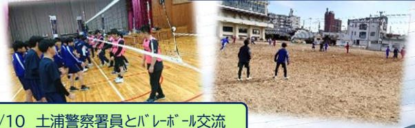
2/10 土浦警察署員とバレーボール交流