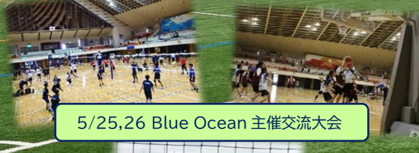
5/25,26 Blue Ocean 主催交流大会