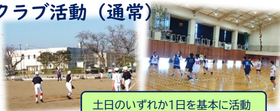
土日のいずれか1日を基本的に活動